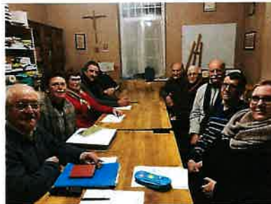
L'association « Les amis d'AMBANJA » au presbytère de Solgne