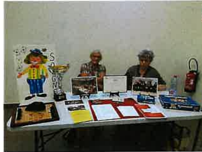
Le club de l'amitié Belotte, scrabble et...goûter