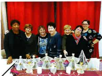
L'atelier des arts déco du C C L I dans l'espace loisirs