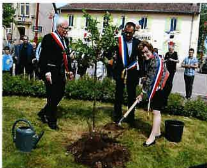
C'est la plantation d'un « Prunier de l'Amitié » En direct d'Agen