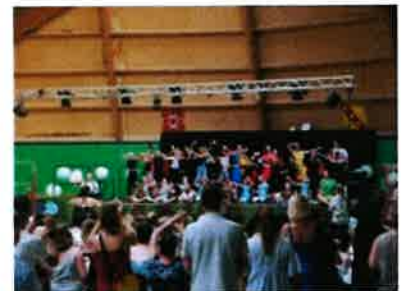
Fin d'année scolaire c'est la fête des écoles sur le podium du gymnase