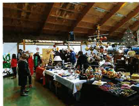
L'association « au cœur de l'école »

A organisé son traditionnel marché de Noël avec une décoration remarquable, des commerçants sympathiques et une restauration savoureuse