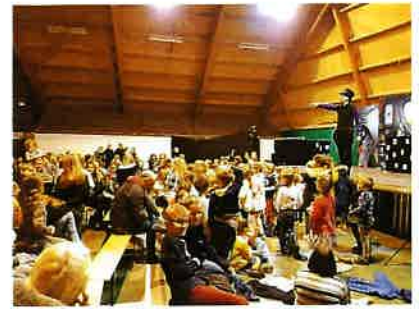
Le Noël du SIVOM Un spectacle de divertissement pour les 300 enfants des 11 communes