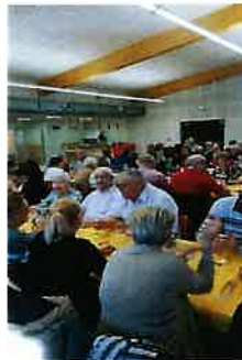
Le repas annuel des aînés salle associative février 2019