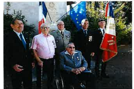
Fête Solgne remise de décoration au monument aux morts par l'U N C Solgne