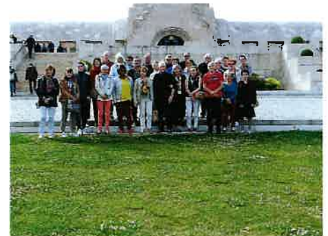
Visite de l'ossuaire et du cimetière 14/18 de Douaumont sur les champs de batailles