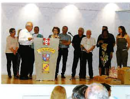
Discours de clôture et échange de cadeaux