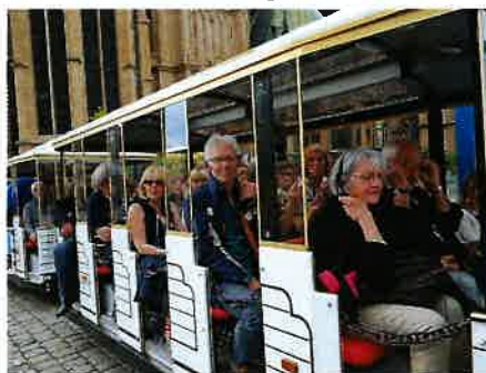
Visite de Metz en petit train