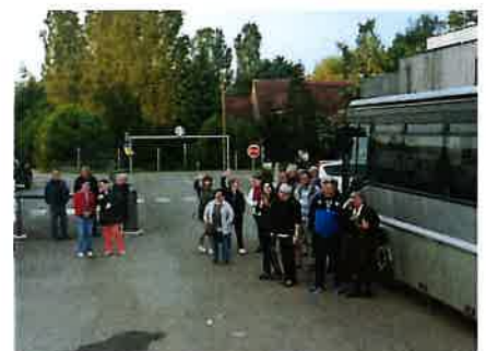
C'est le moment des adieux un au revoir et à bientôt en Gascogne