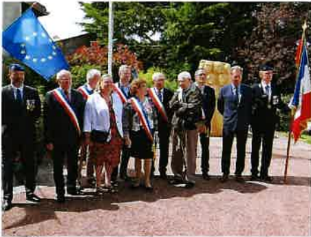
Accueil des personnalités au monument aux morts