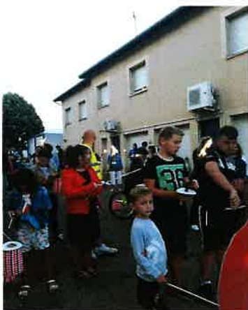
14 juillet à Solgne avec l'U N C la municipalité a organisé la retraite aux flambeaux