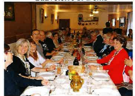
Un repas lorrain à la ferme auberge de Chanteraine Très apprécié