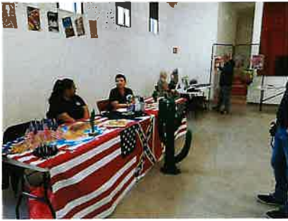
Le forum des associations Salle associative (ici le Country Spirit)