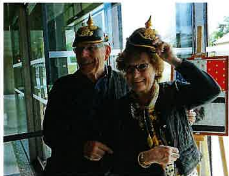
Un prussien et une prussienne au musée de Gravelotte