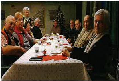
Le « club de l'amitié » à son goûter de NOËL Salle de la mairie