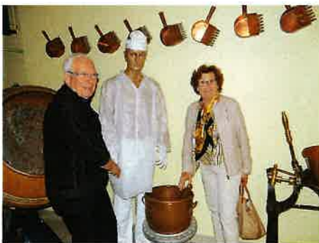
Visite de la fabrique de dragées BRAQUIER à VERDUN